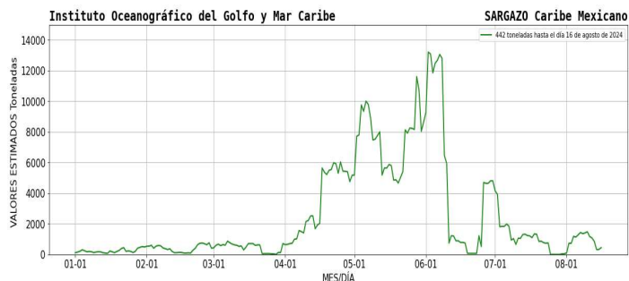
Figura 1.- Densidad de sargazo calculada como una media de los 7 días anteriores (incluido el día actual), basada en las imágenes correspondientes del Índice Alternativo de Algas Flotantes (AFAI) utilizando el método descrito en Wang y Hu (2016). Valores estimados del 01 de enero al 16 de agosto del presente año, obtenidos a partir de datos de la USF.