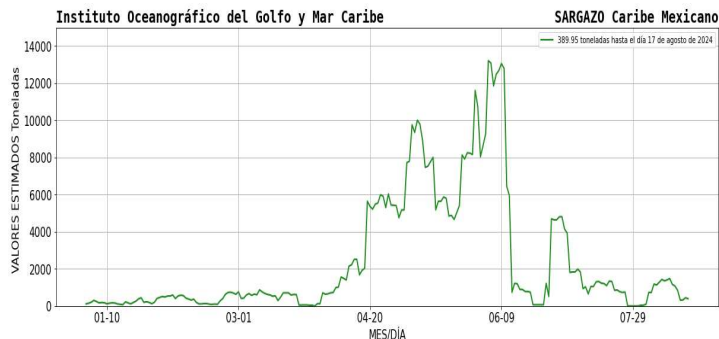
Figura 1.- Densidad de sargazo calculada como una media de los 7 días anteriores (incluido el día actual), basada en las imágenes correspondientes del Índice Alternativo de Algas Flotantes (AFAI) utilizando el método descrito en Wang y Hu (2016). Valores estimados del 01 de enero al 17 de agosto del presente año, obtenidos a partir de datos de la USF.