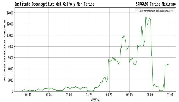
Figura 1.- Densidad de sargazo calculada como una media de los 7 días anteriores (incluido el día actual), basada en las imágenes correspondientes del Índice Alternativo de Algas Flotantes (AFAI) utilizando el método descrito en Wang y Hu (2016). Valores estimados del 01 de enero al 30 de junio del presente año, obtenidos a partir de datos de la USF.