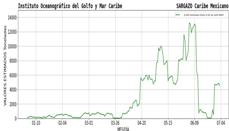
Figura 1.- Densidad de sargazo calculada como una media de los 7 días anteriores (incluido el día actual), basada en las imágenes correspondientes del Índice Alternativo de Algas Flotantes (AFAI) utilizando el método descrito en Wang y Hu (2016). Valores estimados del 01 de enero al 01 de julio del presente año, obtenidos a partir de datos de la USF.

El análisis de las imágenes satelitales del CM, continúa presentando nubosidad, por lo cual no es posible estimar los conglomerados algales; de acuerdo a los modelos de corrientes, para el día de hoy se esperan condiciones favorables sin la presencia de sargazo en Isla Mujeres, Cancún, Pto. Morelos, Mahahual y Xcalak. Para el día de hoy se espera remanentes de sargazo en inmediaciones de Playa del Carmen y Cozumel con 06 Ton y en Tulum con 04 Ton .