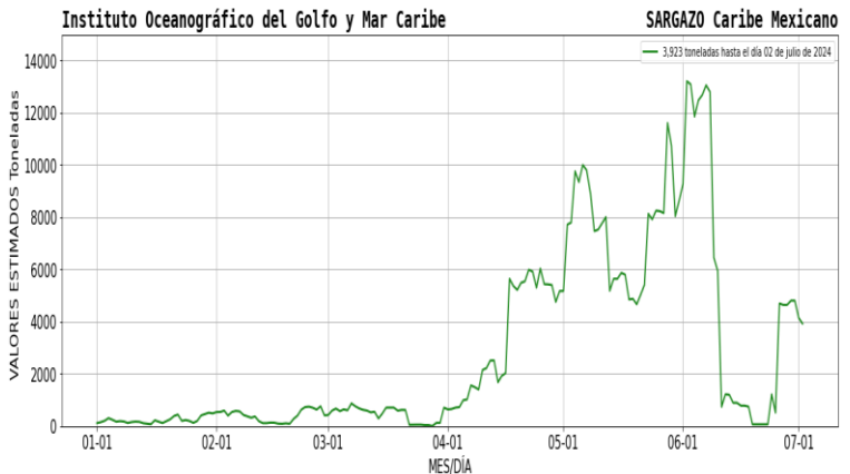
Figura 1.- Densidad de sargazo calculada como una media de los 7 días anteriores (incluido el día actual), basada en las imágenes correspondientes del Índice Alternativo de Algas Flotantes (AFAI) utilizando el método descrito en Wang y Hu (2016). Valores estimados del 01 de enero al 02 de julio del presente año, obtenidos a partir de datos de la USF.