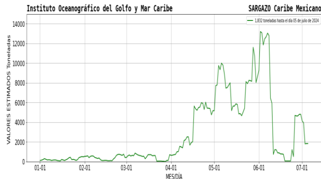
Figura 1.- Densidad de sargazo calculada como una media de los 7 días anteriores (incluido el día actual), basada en las imágenes correspondientes del Índice Alternativo de Algas Flotantes (AFAD) utilizando el método descrito en Wang y Hu (2016). Valores estimados del 01 de enero al 05 de julio del presente año, obtenidos a partir de datos de la USF.

El análisis de las imágenes satelitales del CM, continúa presentando altos porcentajes de nubosidad, por lo cual no es posible estimar los conglomerados algales; de acuerdo a los modelos de corrientes y a los eventos meteorológicos presentes, para el día de hoy se esperan condiciones favorables sin la presencia de sargazo en Isla Mujeres, Cancún, Pto. Morelos, se podrían esperar remanentes de sargazo para las próximas 24 horas en Cozumel, Tulum, Sian Ka'an, Mahahual y Xcalak, sin generar recales masivos para las costas de Quintana Roo.