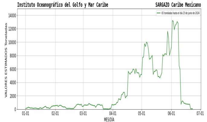
Figura 1.- Densidad de sargazo calculada como una media de los 7 días anteriores (incluido el día actual), basada en las imágenes correspondientes del Índice Alternativo de Algas Flotantes (AFAI) utilizando el método descrito en Wang y Hu (2016). Valores estimados del 01 de enero al 23 de junio del presente año, obtenidos a partir de datos de la USF.

El análisis de las imágenes satelitales del CM, continua presentando cantidades elevadas de densidad nubosa en toda el área debido a eventos meteorológicos que se han presentado, por lo cual no es posible estimar algún conglomerado algal, sin embargo, de acuerdo a los modelos de corrientes, para el día de hoy se esperan condiciones favorables sin la presencia de sargazo en Isla Mujeres, Cancún, Mahahual y Xcalak; y en las próximas horas se pudieran esperar el arribo de remanentes de sargazo con un aproximado de 10 Ton para Pto. Morelos, 11 Ton en Playa del Carmen y al este de Cozumel, un aproximado de 5 Ton en inmediaciones de Tulum.