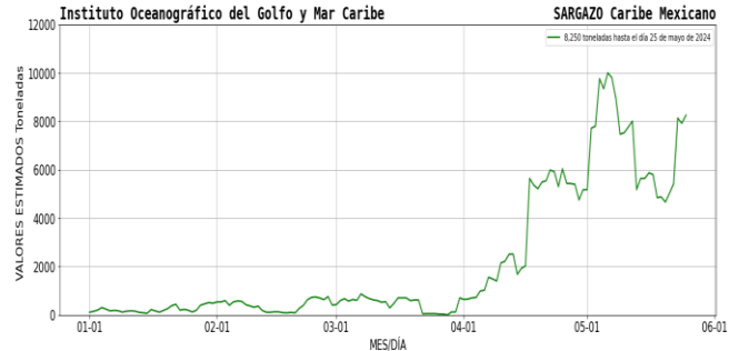
Figura 1.- Densidad de sargazo calculada como una media de los 7 días anteriores (incluido el día actual), basada en las imágenes correspondientes del Índice Alternativo de Algas Flotantes (AFAD) utilizando el método descrito en Wang y Hu (2016). Valores estimados del 01 de enero al 25 de mayo del presente año, obtenidos a partir de datos de la USF.