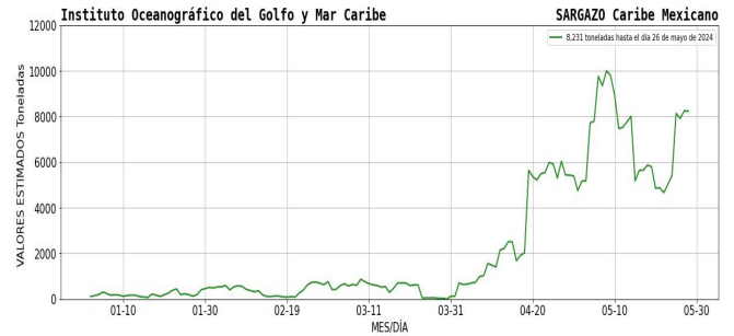
Figura 1.- Densidad de sargazo calculada como una media de los 7 días anteriores (incluido el día actual), basada en las imágenes correspondientes del Índice Alternativo de Algas Flotantes (AFAI) utilizando el método descrito en Wang y Hu (2016). Valores estimados del 01 de enero al 26 de mayo del presente año, obtenidos a partir de datos de la USF.