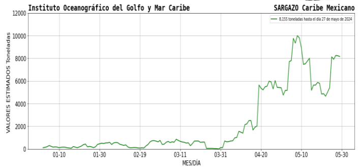
Figura 1.- Densidad de sargazo calculada como una media de los 7 días anteriores (incluido el día actual), basada en las imágenes correspondientes del Índice Alternativo de Algas Flotantes (AFAD) utilizando el método descrito en Wang y Hu (2016). Valores estimados del 01 de enero al 27 de mayo del presente año, obtenidos a partir de datos de la USF.