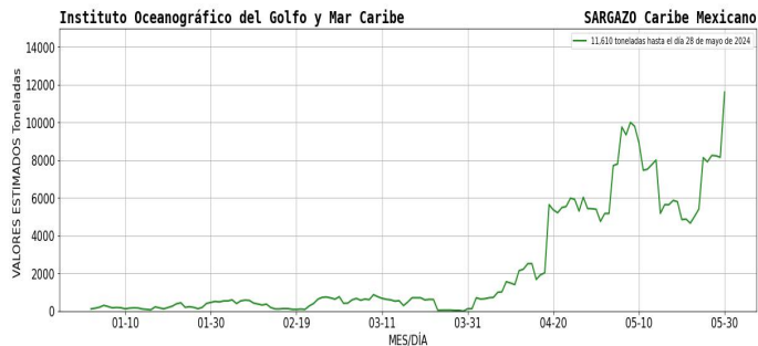
Figura 1.- Densidad de sargazo calculada como una media de los 7 días anteriores (incluido el día actual), basada en las imágenes correspondientes del Índice Alternativo de Algas Flotantes (AFAI) utilizando el método descrito en Wang y Hu (2016). Valores estimados del 01 de enero al 28 de mayo del presente año, obtenidos a partir de datos de la USF.