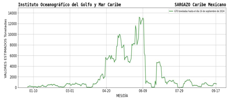
Figura 1.- Densidad de sargazo calculada como una media de los 7 días anteriores (incluido el día actual), basada en las imágenes correspondientes del Índice Alternativo de Algas Flotantes (AFAI) utilizando el método descrito en Wang y Hu (2016). Valores estimados del 01 de enero al 16 de septiembre del presente año, obtenidos a partir de datos de la USF.